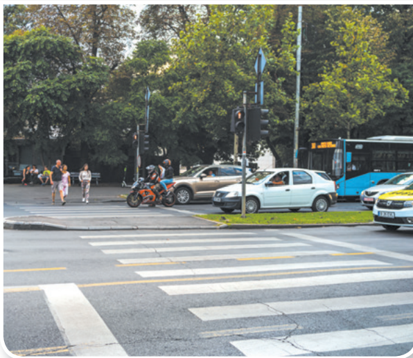
trafic – circulație pe drumuri publice