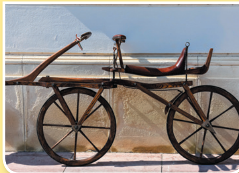
Mașina de fugă

Prima bicicletă a fost inventată la sfârșitul secolului al XVIII-lea, adică în jurul anului 1790. Conte de Mede de Sivrac a inventat atunci celeriferul , care avea să fie primul mijloc de transport individual. După 27 de ani, un conte german, dornic să revoluționeze mașinăria care era destul de greu de folosit, a adus niște îmbunătățiri importante, cum ar fi posibilitatea de a schimba direcția, și și-a denumit „mașina de fugă” (așa cum o alinta) drezină (după numele său). Câțiva ani mai târziu drezina ajunge în atenția unui francez, care a denumit-o velociped , iar principala modificare adusă a fost că materialul folosit la confecționare nu mai era lemnul, ci fonta, mult