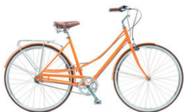
Bicicletă de oraș

În prezent, există multe tipuri de biciclete, de la biciclete folosite în oraș, la biciclete utilizate pe munte sau sprintările biciclete folosite la curse. Între timp a apărut și un sport, ciclismul, accesibil tuturor. Cel mai cunoscut concurs de ciclism este Turul Franței. Este foarte urmărit de oameni din lumea întreagă, nu doar pentru emoția cursei, ci și pentru frumusețea peisajelor și ocazia de a învăța câte ceva despre minunata Franță.