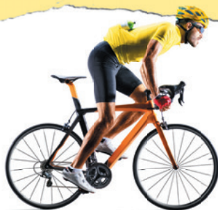
Bicicletă de curse